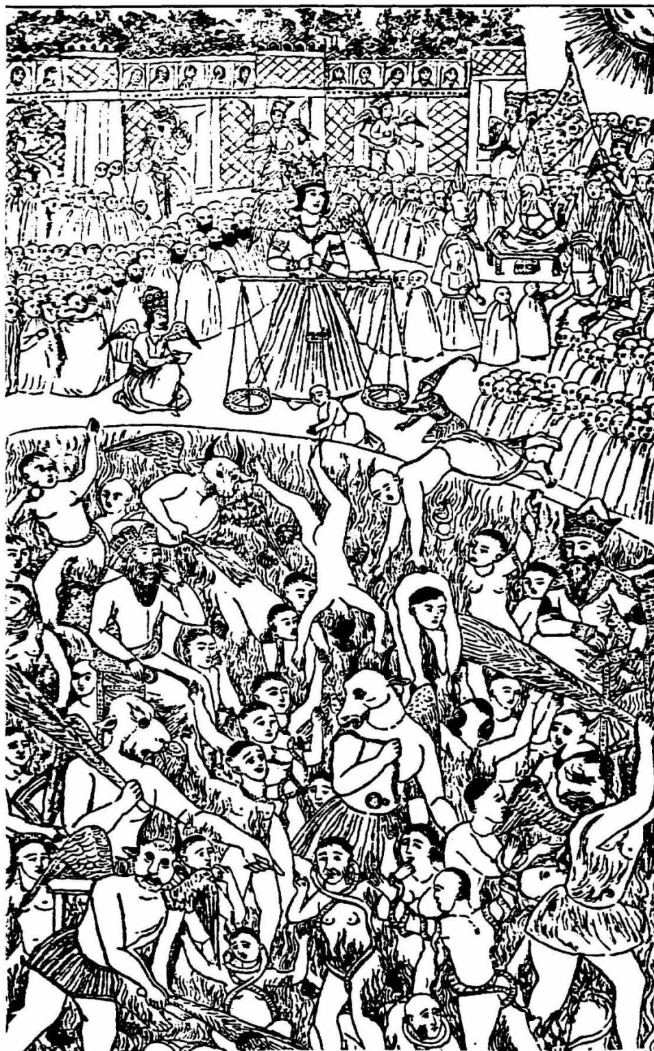
نمای پنداری دیدمان مسخره وزن کشی اعمال و رفتار انسان در روز قیامت